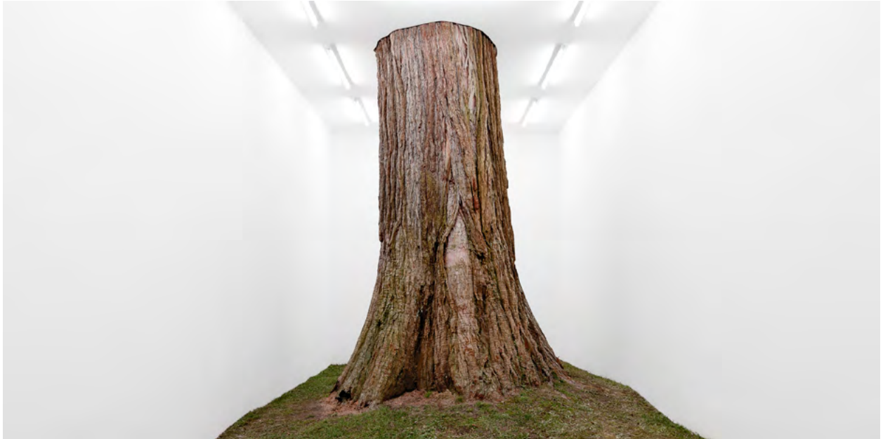
Fabian Knecht: »Isolation – Stamm«. Courtesy alexander levy, Berlin. Foto: ©Fabian Knecht.

Ausstellung im Künstlerverein Walkmühle Wiesbaden vom 23.8. bis 10.11.2024