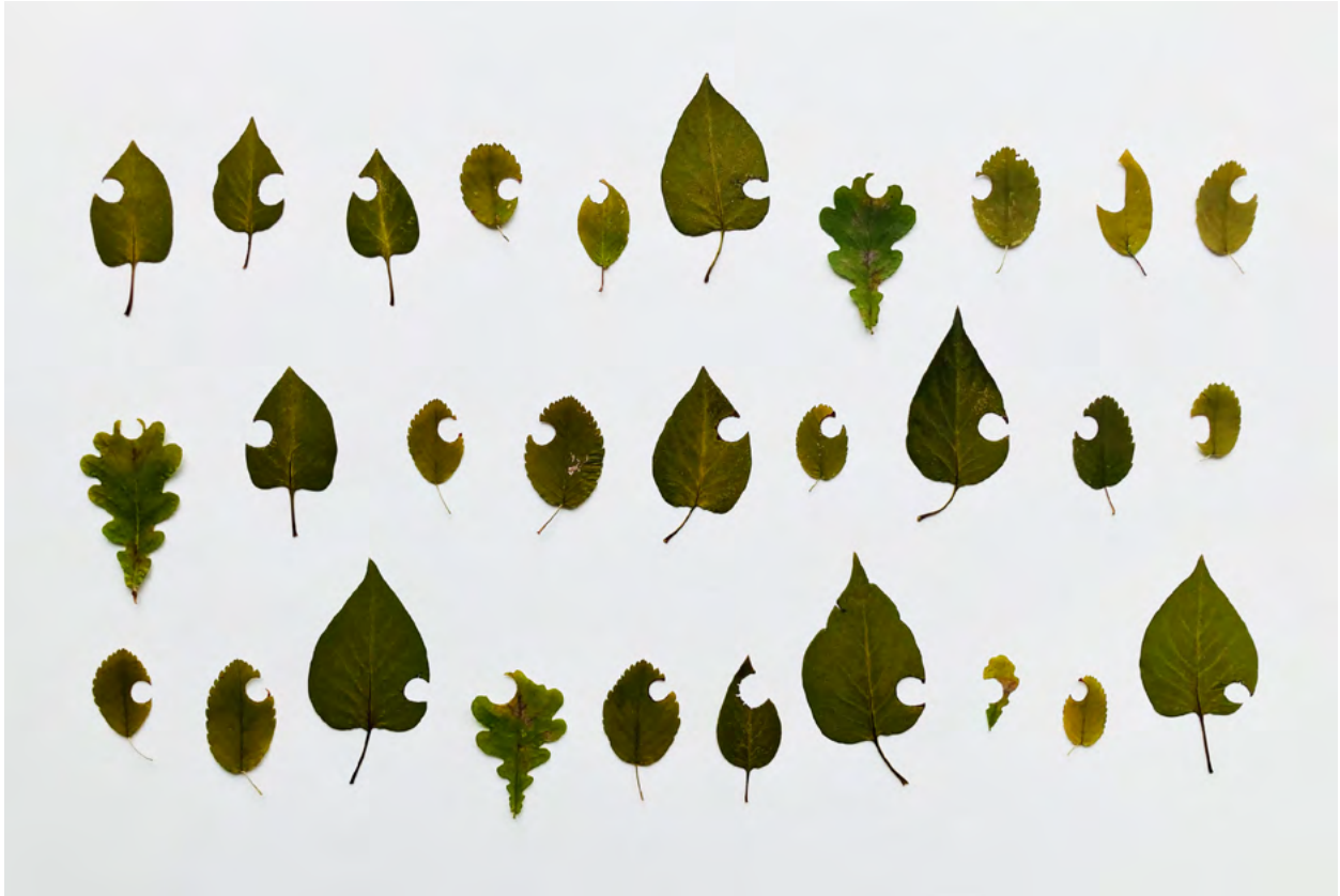
Maike Denker: »Coding«, 2024. In Kooperation mit Blattschneiderbienen geschnittene Blätter unterschiedlicher Gehölze auf Papier.