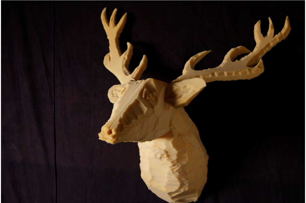
Dina Shenhav: Detail aus der Installation »Death On Arrival«, 2016, Schaumstoff und Leim.