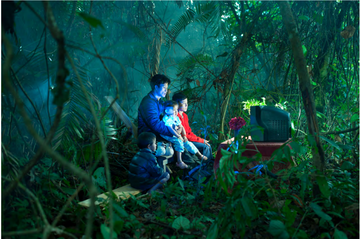
Sharbendu De: »Waiting in the Forest« aus der Serie »Imagined Homeland«, 2018, digitale Fotografie.

Der Ausstellungstitel »Zwischen Wurzel und Wipfel« beschreibt dabei keinen statischen Zustand, sondern einen gedachten Raum, der sich zwischen den einzelnen Akteuren des Waldes als Netzwerk aufbaut: Denn der Wald ist wesentlich mehr als die Summe seiner Bäume . Im »Dazwischen« lebt eine bunte Gemeinschaft in einem systemischen und symbiotischen Miteinander, das allerdings von menschlichen Eingriffen gezeichnet und daher in seiner Funktionstüchtigkeit herausgefordert wird. In der neuen Ausstellung des Künstlervereins Walkmühle wird dieses lebendige Netzwerk durch die einzelnen künstlerischen Positionen fragmentiert dargestellt. Die isolierten Fragmente tragen erzählfreudige Spuren, aus deren Perspektive sich das Gesamtbild des Ausstellungsthemas entwickelt.